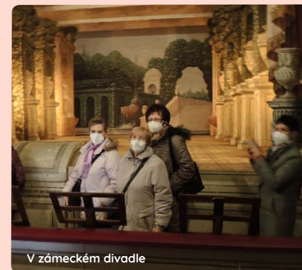
V zámeckém divadle

Potom jsme se přesunuli k zámku, kde jsme prošli základní okruh – Zámek Valdštejnů. Tento okruh zahrnuje prohlídku prvního patra západního křídla zámku - předpokojí, audienčního sálu, zeleného a modrého salonu, pracovny hraběte, ložnice hraběcího páru, čítárny, biliáru, salonu hraběnky, ložnice pro hosty, kávové kuchyně s bydlením komorné. Na závěr okruhu jsme navštívili autentické domácí divadlo Valdštejnů-Vartenberků. V zámeckém sklepení jsme zhlédli srdce pro Václava Havla, sochy Olbrama Zoubka a už chystanou výstavu vánočních stromků s krásnými ozdobami.