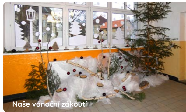
Naše vánoční zákoutí