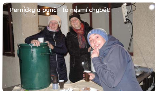
Perníčky a punč - to nesmí chybět!

Pomalou se setmělo, vše je připraveno, nádherná atmosféra na nás dýchá. Sbor má poslední zkoušku, pomalu se scházejí občané a je to tu. Pan starosta nás přivítá a popřeje krásné chvíle. Začnou hrát klávesy, děti zpívají. No nádherná, a pak přistoupí dva andělé se svíčkou, počítáme čtyři, tři, dva, jedna a strom svítí. Všichni jsou spokojeni, že zas můžeme zažít tyto chvíle. A je konec. Punč vypitý, písničky zazpívány a pomalu se všichni rozcházejí. Letos jsme měli sněhovou nadílku, kterou si děti plnými doušky vychutnávaly a užily po svém. Vše poklidit a teď se už každý večer můžeme dívat na náš strom a čekat až nastanou vánoční svátky. Ještě jednou všem děkujeme za krásné chvíle.