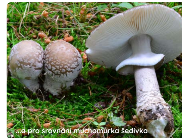
...a pro srovnání muchomůrka šedivka