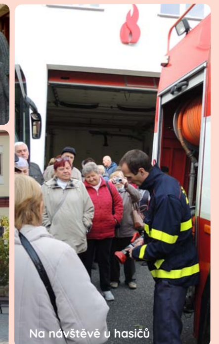
Na návštěvě u hasičů