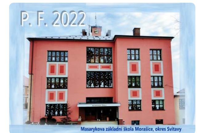
Masarykova základní škola Morašice, okres Svitavy