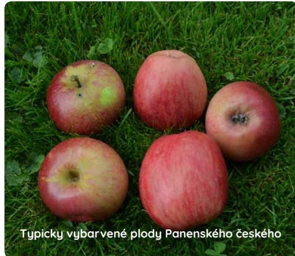
Typicky vybarvené plody Panenského českého