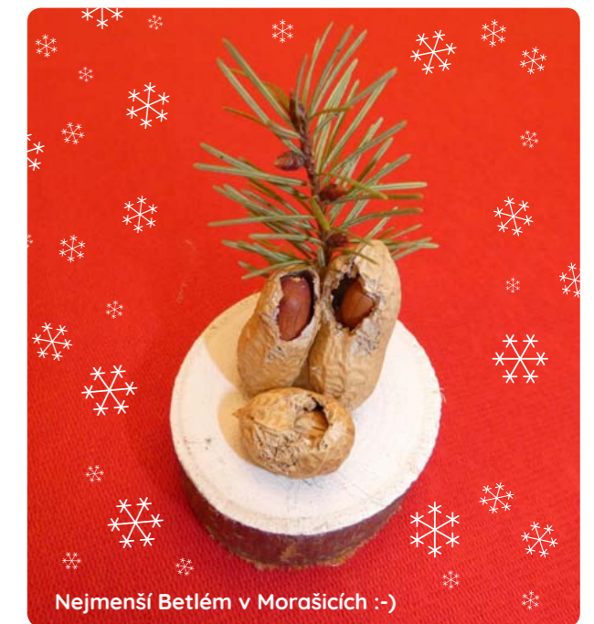
Nejmenší Betlém v Morašicích :-)