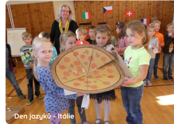
Den jazyků - Itálie

K prvním velkým školním projektům patřil Den jazyků. V září si každá třída vylosovala jednu evropskou zemi a žáci pak ve všech předmětech získávali informaci o dané zemi. Akce vyvrcholila 11. 10. v tělocvičně, kde se pod vedením dramatického kroužku jednotlivé třídy představily. Byla to velmi vydařená akce. Bližší informace čtete v příloze 1. čísla Třesku.