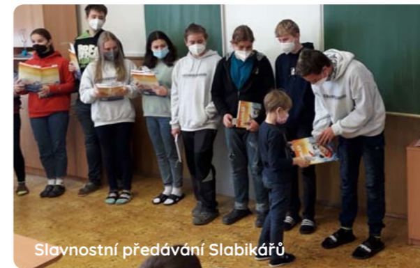
Slavnostní předávání Slabikářů

K dalším projektům patří spolupráce 1. a 9. třídy. Ta se daří velmi příjemně a v těchto dnech předávali devátáci prvňákům slabikáře. Každý přidal pár milých slov, která těm svým prvňákům přejí, a věnoval malý osobní dáreček v podobě záložky.