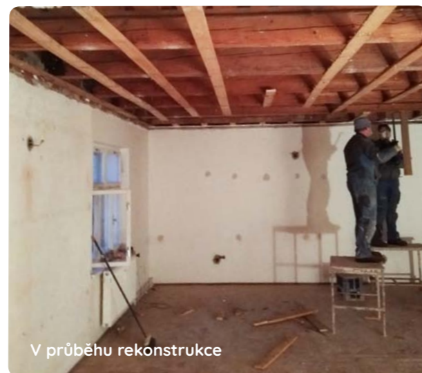
V průběhu rekonstrukce

A k čemu nám bude sloužit? Využívá se na zasedání zastupitelstva, může se tu konat vítání občánků, školení a snad někdy nějaké sousedské posezení. Jako je například Den matek, menší vánoční koncert, promítání a hlavně je tu i možnost si místnost zapůjčit na menší rodinné oslavy.