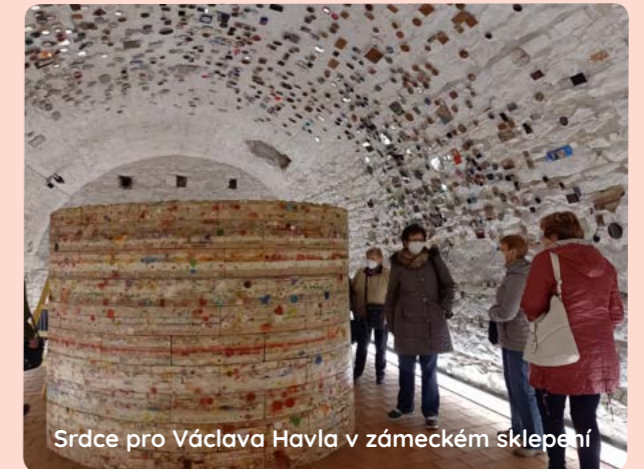
Srdce pro Václava Havla v zámeckém sklepení

Výlet se uskutečnil v úterý 26. 10. a možnost jet na výlet využilo 35 důchodců. Kvůli opatřením už nemohla probíhat prohlídka u hasičů ve vnitřních prostorách. Před stanicí nás přivítal velitel stanice Lukáš Faltys. Zajímavostí o provozu a zásazích hasičského záchranného sboru sdělil velitel směny pan Jaroslav Vejrych a dále hasiči Zdeněk Chadima a Jakub Sejkora. Předvedení techniky a poutavé vyprávění bylo zajímavé pro všechny.