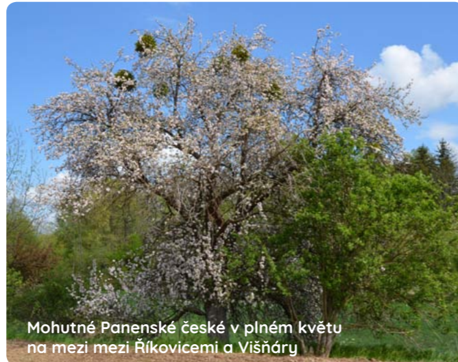
Mohutné Panenské české v plném květu na mezi mezi Říkovcemi a Višňáry