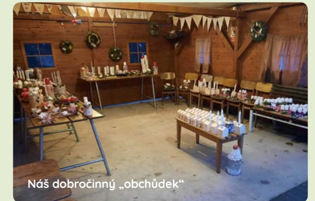
Náš dobročinný „obchůdek“

Koncem listopadu byly zakoupeny obcí Morašice další dvě hasičské uniformy pro ženský dobrovolný hasičský sbor.