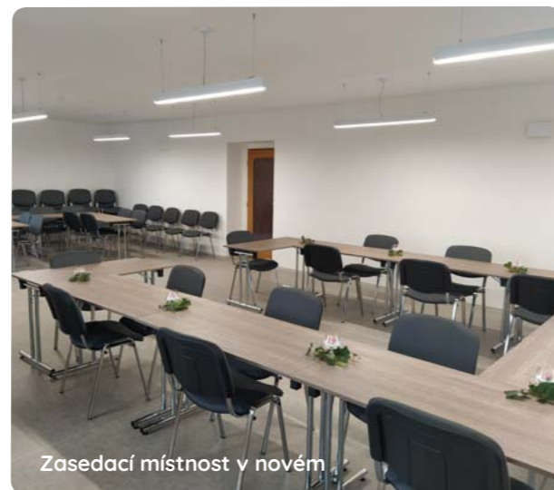
Zasedací místnost v novém