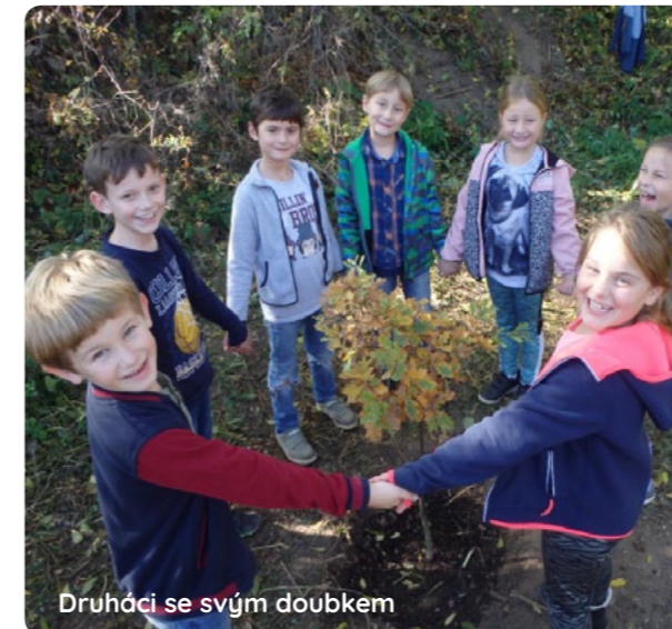
Druháci se svým dóbkem

Děkuji všem za sběr a podporu. Stanislava Coufalová