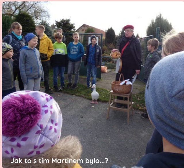
Jak to s tím Martinem bylo...?