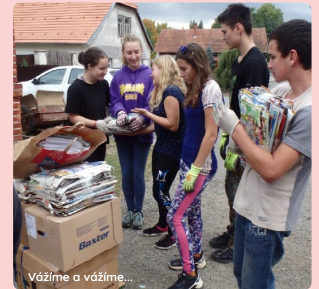
Vážíme a vážíme...