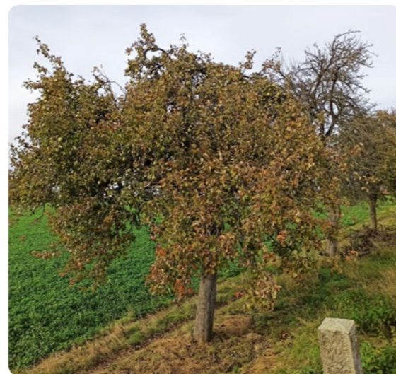
Stromy této odrůdy jsou typické menšími širokými korunami