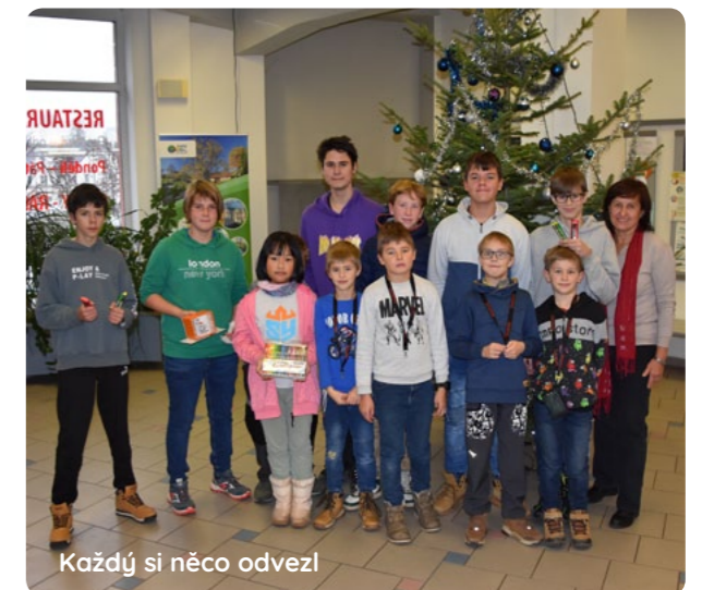
Každý si něco odvezl

„Není důležité zvítězit, ale zúčastnit se.“ Pierre de Coubertin