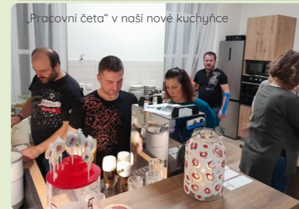
„Pracovní četa“ v naší nové kuchyňce