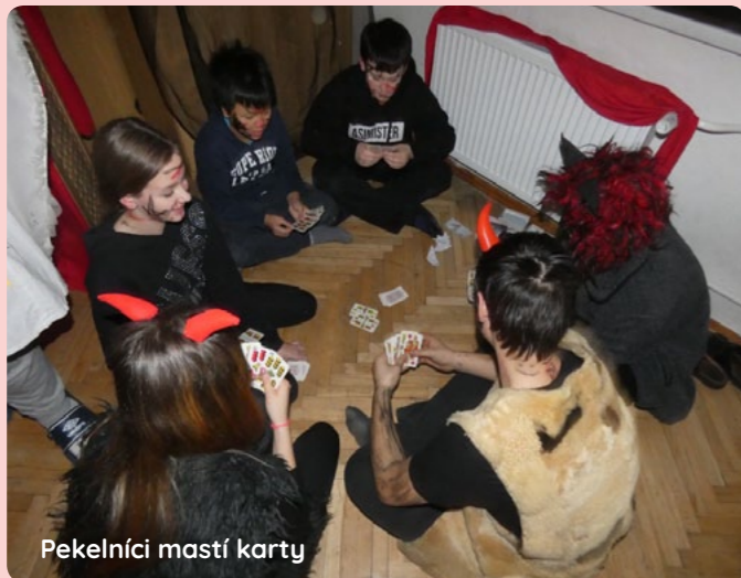
Pekelníci masť karty