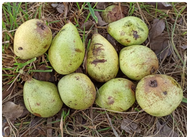
Pařížanky neohromí krásou plodů, ale kdo by si nedal čerstvou hrušku o Vánocích...