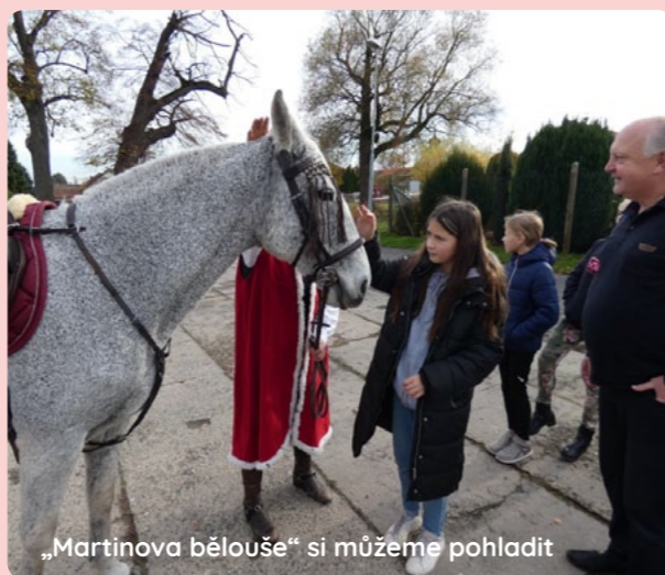
„Martinova bělouše“ si můžeme pohladit