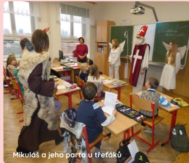
Mikuláš a jeho parta u třetíků