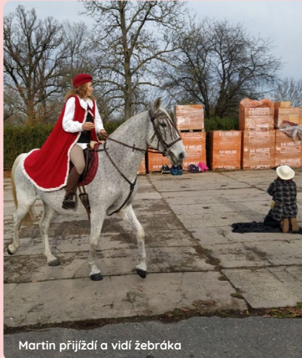
Martin přijíždí a vidí žebráka