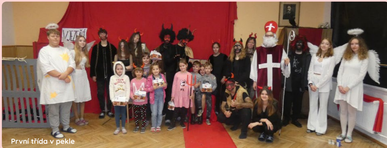
První třída v pekle