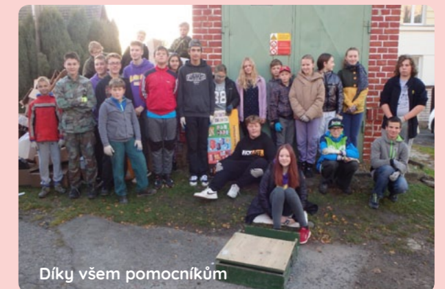
Díky všem pomocníkům