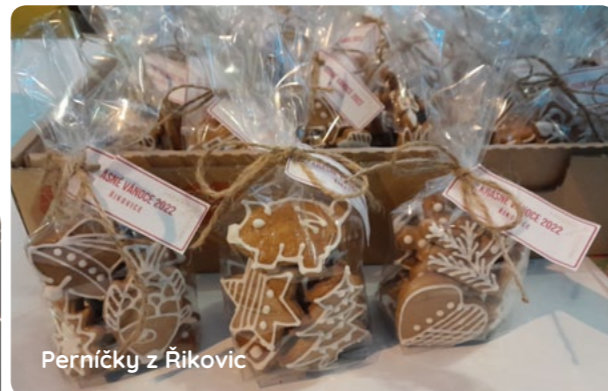
Perníčky z Řikovic