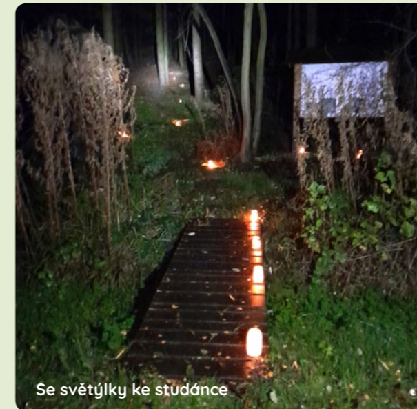
Se světýlky ke studánce

Množily se nám dotazy ze všech stran, kdy konečně uzavřeme naši studánku. Pořád ji jenom otvíráme, ale před zimou jsme ji ještě ani jednou nezamkli. A tak jsme se dohodli změnit náš naplánovaný program. Spojili jsme lampiónový průvod s procházkou ke studánce. V sobotu 5. 11. jsme se sešli před bývalou školou. Nejprve jsme za zvuku státní hymny uctili památku padlých položeni věnce a zapálením svíce. Následně jsme se vydali do tmy jen za svitu lampiónových světel, lucerniček, baterek, prostě se vším, co svítí, směrem k Višňárům k naší studánce U Jezírka. Studánku jsme básničkou a vílím tancem zamkli na klíč k zimnímu spánku. Těšíme se na jaro, kdy ji zase slavnostně společně otevřeme. Průvod se poté odebral zpět ke škole, kde děti dostaly sladkou odměnu za to, že cestu bez problémů zvládly. Maminky připravily na zahřátí dětem čaj a dospělým svařák. K občerstvení se podával výborný guláš. Toto společné setkání jsme rovněž pojali jako kolaudaci nově opravené společenské místnosti. Tradičně se také po občerstvení promítalo video, které připomnělo letošní akce a události, které se odehrály u nás v Řikovicích. A že jich bylo na tak malou vesničku! Díky Vám všem, kteří s akcemi pomáháte a účastníte se jich.