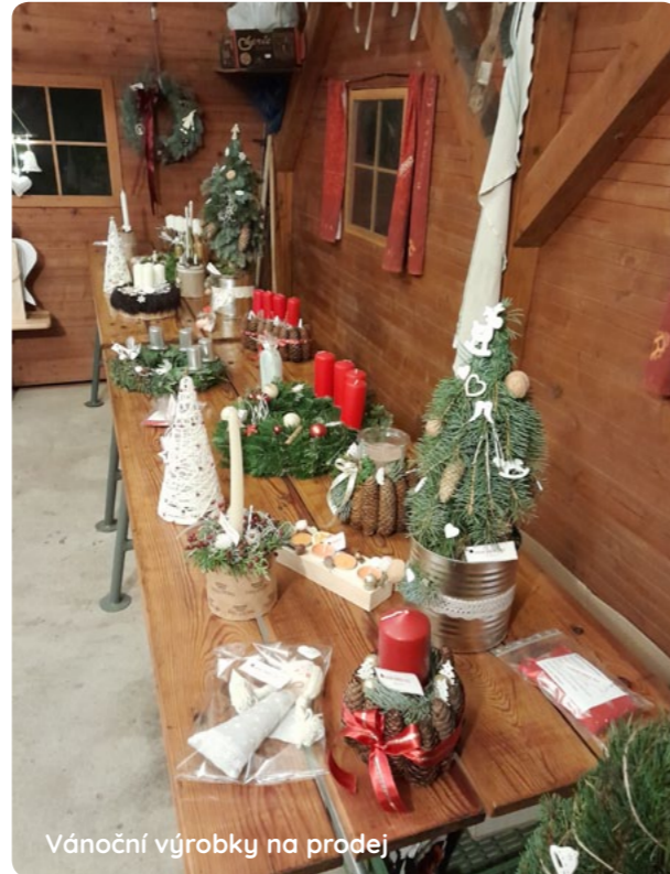
Vánoční výrobky na prodej