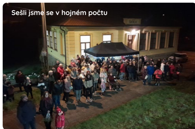
Sešli jsme se v hojném počtu