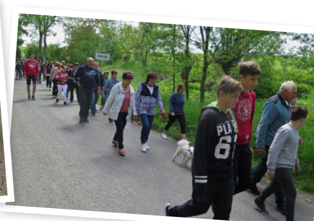
...a průvod ke studánce