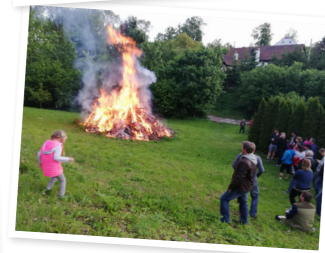
Kácení májky a pálení čarodějnic