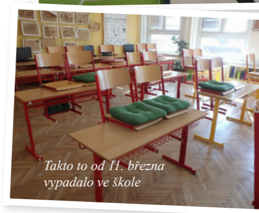
Takto to od 11. března vypadalo ve škole