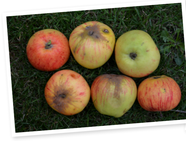
Panské jablko - plody jsou typické zejména svou velmi mělkou a silně rzivou stopečnou jamkou