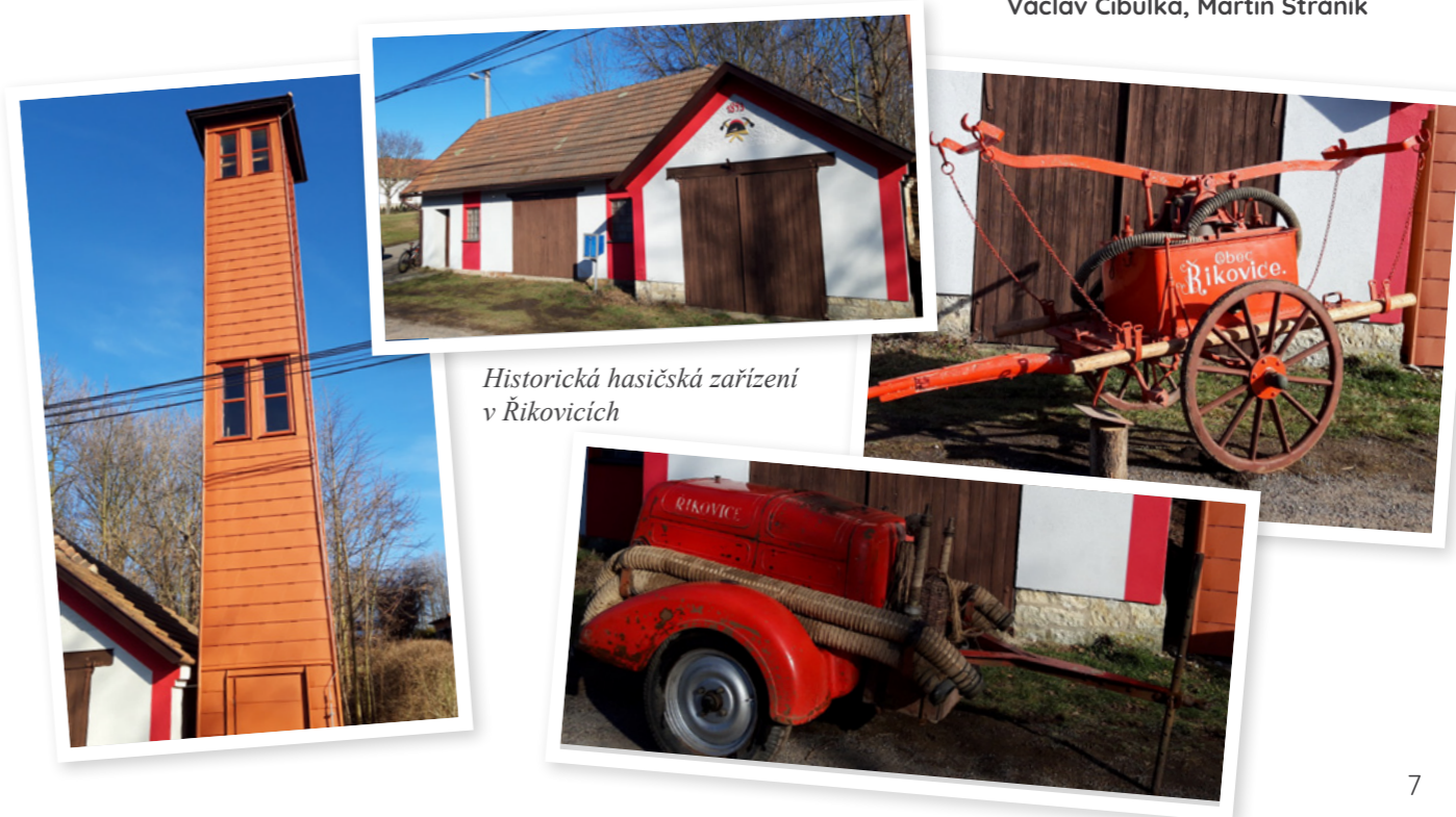
Historická hasičská zařízení v Řikovicích