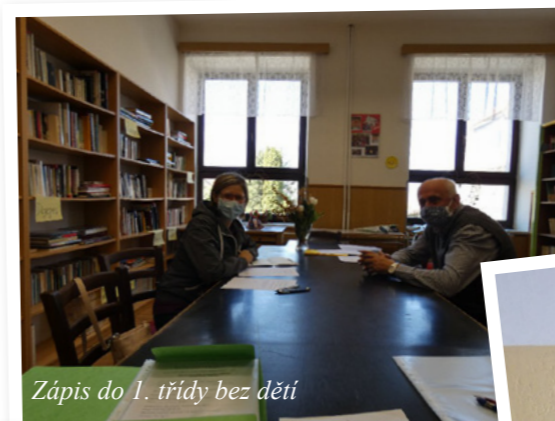
Zápis do 1. třídy bez dětí