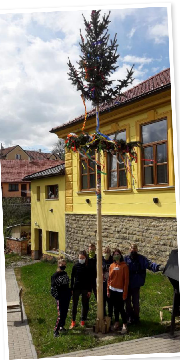
Májka v Řikovicích