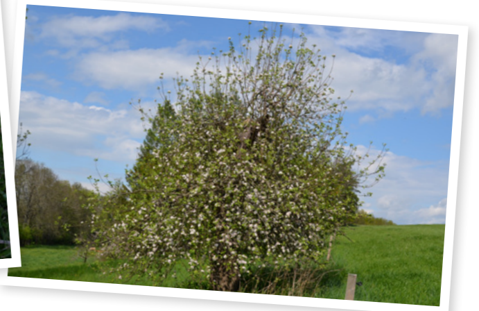
Ořezané a obrostlé torzo starého stromu odrůdy Panské za barokní sýpkou v Sedlišťce