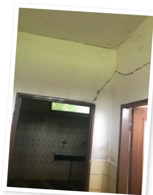
Havarijní stav umývárny, technické místnosti i ostatních prostor před rekonstrukcí.