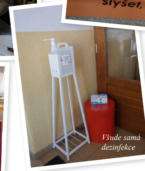
Všude samá dezinfekce