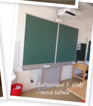
Zařizování 1. třídy - nová tabule