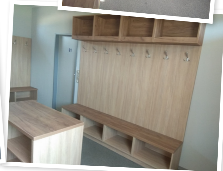
Nové kabiny po rekonstrukci.