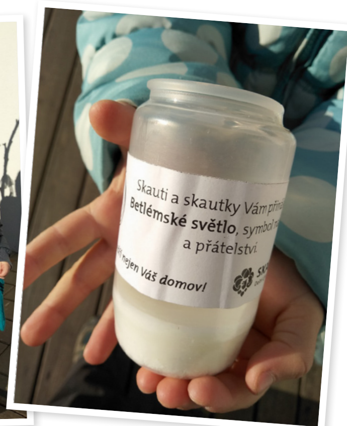
Betlémské světlo od skautů