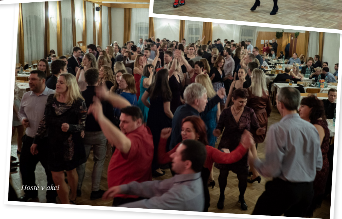
Hosté v akci