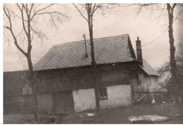
Fotografie domu z roku 1960

Chalupa byla od roku 1985 prázdná a v roce 1989 byla zbourána.