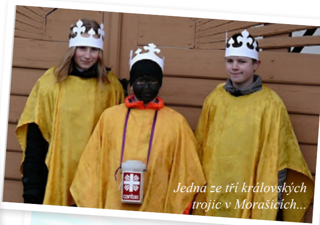
Jedna ze tří královských trojic v Morašicích...