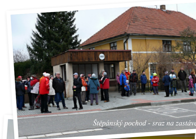
Štěpánský pochod - sraz na zastávce