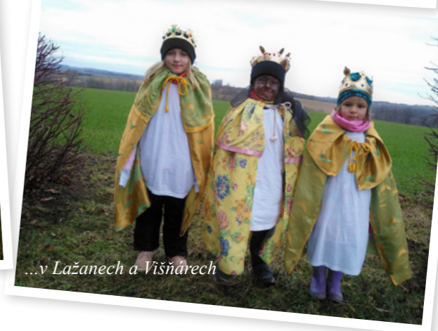
...v Lažanech a Višňárech