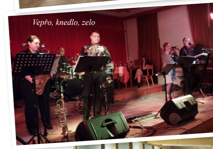
Vepřo, knedlo, zelo