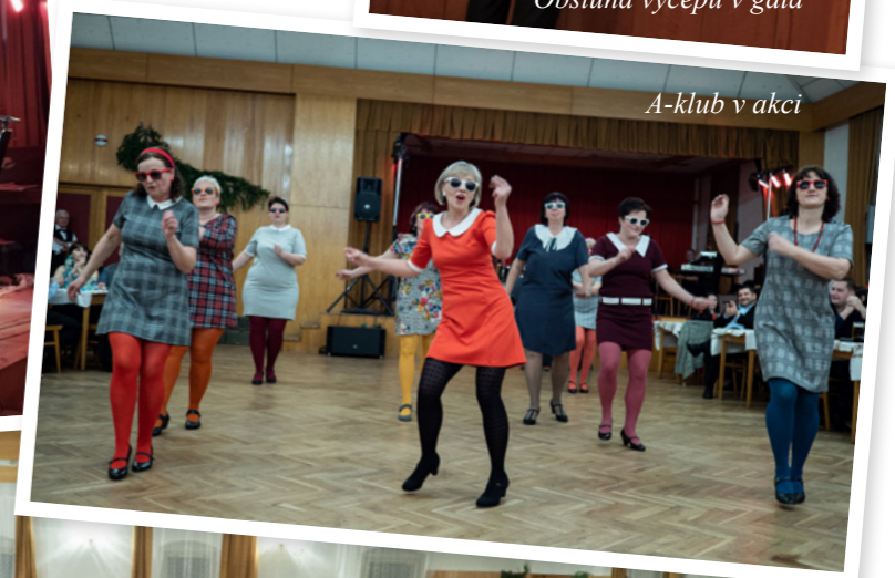
A-klub v akci