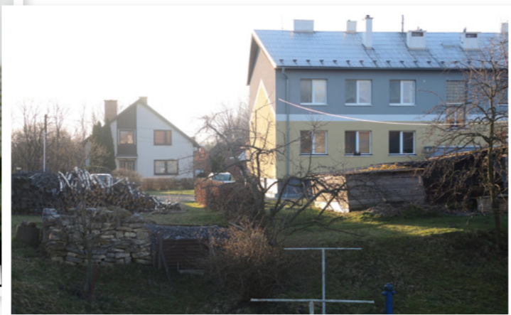
Místo, kde stavení stávalo