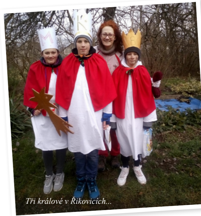
Tři králové v Říkovcích...