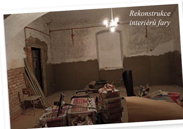
Rekonstrukce interiéru fary

Co nás vedlo k vytvoření Komunitního centra PŘÁTELSTVÍ? První věcí byla touha využívat faru pro různé aktivity farnosti, obce a dalších organizací. Dále to byla neutěšená situace vnitřních prostor budovy. Byly třeba opravit, neboť stavba chátrala a technické i sociální zázemí fary bylo historické a nevyhovující jak z hygienického hlediska, tak z funkčního hlediska (suché záchody, koupelnička se starou vanou a kamny s nádrží na ohřev teplé vody, lokální topení atd.). Problémem jako u většiny věcí v současné době bylo financování. Farnost by na opravu z vlastních prostředků neměla. Proto jsme hledali možnosti, jak finance získat. Naskytla se nám možnost u MAS Litomyšlsko, která vyhlásila dotační titul na komunitní centra. Tak jsme do toho šli.