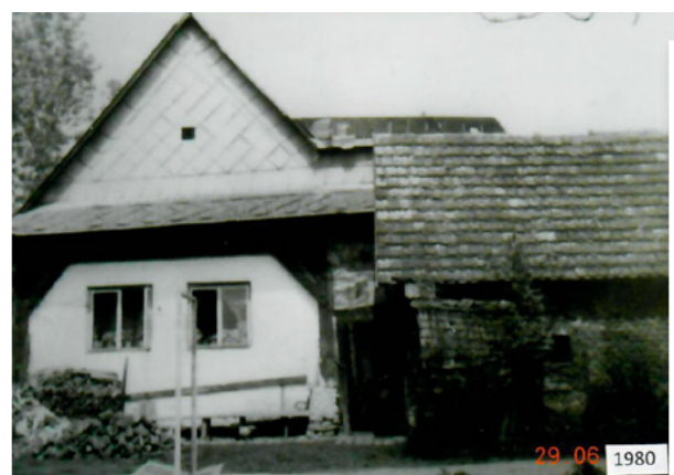
Stav domu v roce 1980