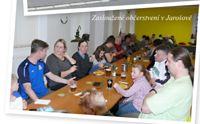
Zasloužené občerstvení v Jarošově

Vážené důchodci, jarní výlet za krásami naší vlasti bychom moc rádi uskutečnili. Současná situace ale zatím nedovoluje nic bližšího připravovat, památky jsou uzavřeny, větší akce jsou zakázány. Pokud bezpečnostní opatření pomínou a bude možno výlet na květen připravit, určitě ho zajistíme. Je však pravděpodobné, že Vás o tom budeme moci informovat třeba až na poslední chvíli. Pokud by to opatření nedovolila, museli bychom výlet uskutečnit až na podzim. Děkujeme za pochopení.