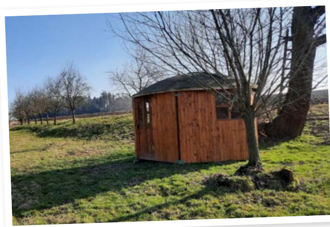
Altánek v Dolcích

Dříve z Řikovic do Dolců vedlo vícero cest a pěšin, ale bohužel jsou dnes všechny rozorány. Zatím se nám nepodařilo žádnou cestu obnovit, aby mohla být k procházkám využívána.