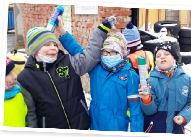
Poklady na sběrném dvoře

Ve školní družině se učíme třídit odpad. Ve škole máme kontejnery na plasty, papír, sklo a biologický odpad. Seznamujeme se i se tříděním odpadu v naší vesnici. Odpad v Morašicích dáváme nejenom do velkých kontejnerů u prodejny, ale s čím si nevíme rady, pokračujeme do sběrného dvoru Obecního úřadu v Morašicích. Děti také správně našly, kam se v obci, vedle pošty, ukládají vybité monočlánky a další baterie.