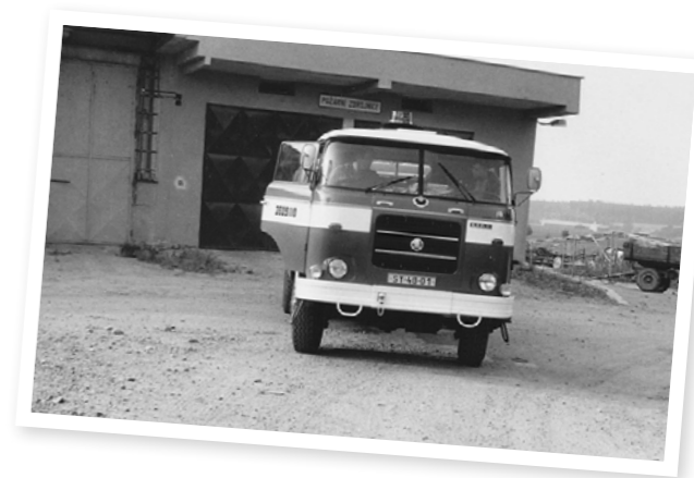
Nové požární auto před novou garáží, 1982