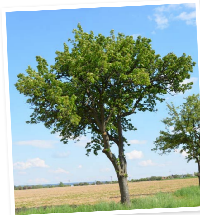
Mohutné Solanky můžeme potkat v aleji mezi Jiřikovem a Dolním Újezdem