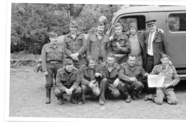
Okrsková soutěž Horky, 1980

v roce 1981-1982 v akci „Z“ za pomoci MNV, JZD a brigádníků byla postavena požární zbrojnice na mechanizačním středisku JZD. V roce 1982 byla do ní pořízena úplně nová autocisterna Š 706 RTH CAS 25 s nádrží 3,5 tis. litrů. Z požární jednotky se stala jednotka výjezdová do okolních obcí k požárům či povodním. Dá se říci, že tato výjezdová jednotka funguje dodnes. Hasiči se rovněž účastní okrskových soutěží družstev, a to okrsku Morašice.