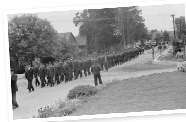
Oslavy 100 let založení Hasičského sboru Morašice, 1981